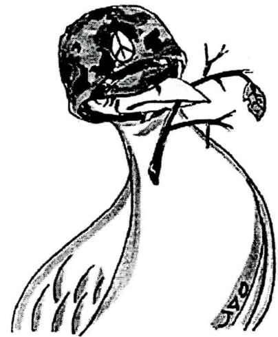
La situación, también centrada en la desmilitarización, la justicia, el respeto a los derechos humanos y la integridad. (Ilustración por Juan Alvarez O'Neill)

Nuestro corazón se sobrecogió al visitar varios enclaves protestantes y católicos en zonas fronterizas al norte de Belfast, en las cuales una mera pared o una calle de casas abandonadas, desoladas y destrozadas por bombas y artefactos explosivos separan tajantemente unos barrios de otros. Justo un día antes de que estallaran nuevos disturbios, vimos anticipos de las protestas y enfrentamientos de la veraniega "Temporada de Marchas". En algunos puntos de conflicto, constatamos las tensiones y hostilidades entre